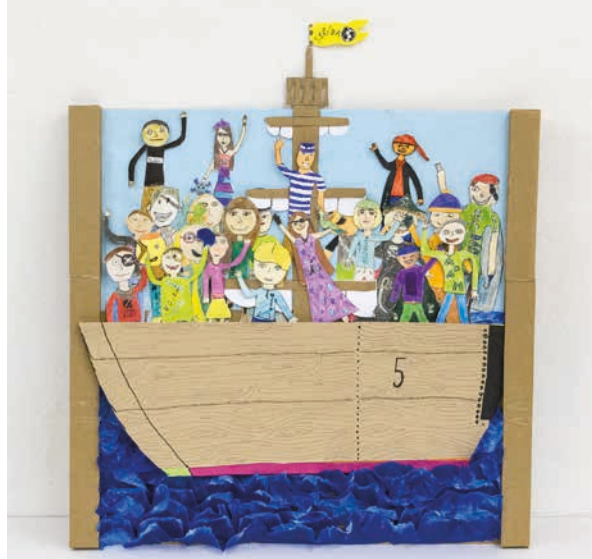
↑ Prostor, 3.kat., 1.místo, kolektiv žáků 5.tř., Plavba do šestky, ZŠ a MŠ Kanice ↓ Prostor, 2.kat., cena GŘ, kolektiv dětí 2.B, Námořníci z Nádražky, ZŠ Nádražní Hustopeče u Brna