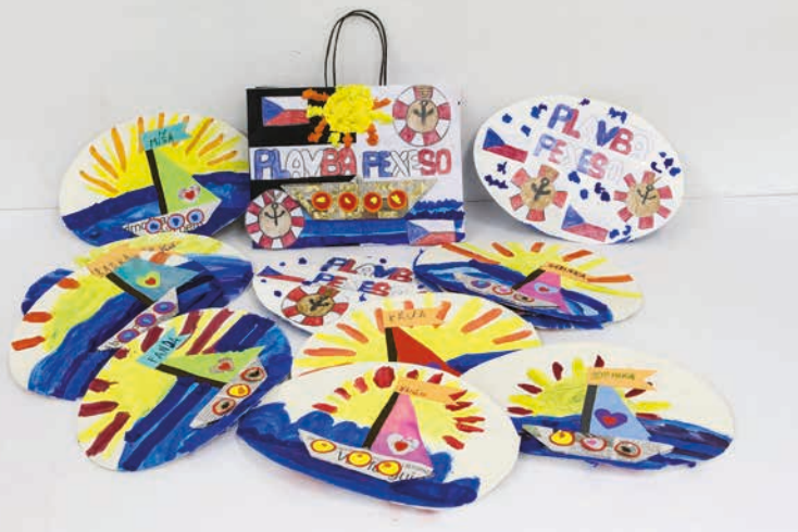
↑ Prostor, 2.kat., cena RR, kolektiv dětí, Voda a plavba, ZŠ Brněnec ↓ Prostor, 3.kat., 2.místo, kolektiv dětí, Výletní plavba, ZŠ a MŠ Drnovice