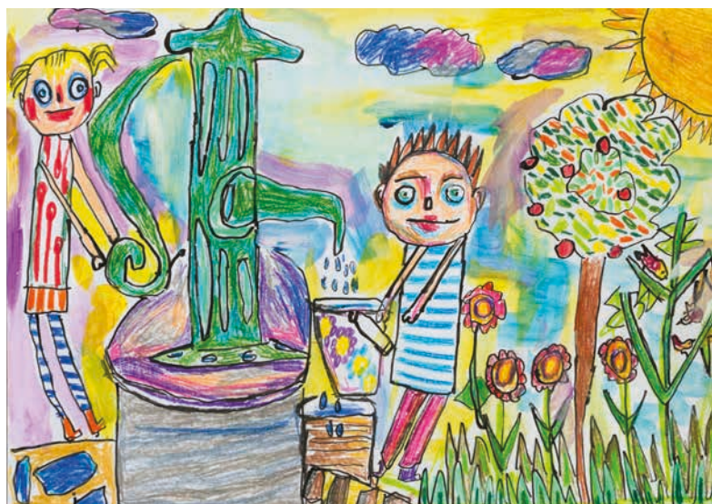
↓ 1. kat., 3. místo, třída Berušky, Šetříme s vodou, ZŠ a MŠ Drnovice

Zašli k němu domů a řekli mu: „Petře, voda v tůnce se špiní, když si v ní myješ kelímky od barev, to nejde, voda je pro všechny! Ostatní ji nemohou používat na mytí, ani na pití! Vezmi si vědro, naber si do něj vodu a jak si kelímky umyješ od těch přírodních barev, co používáš, tak vodou ještě můžeš zalit rostliny na své zahrádce!“ A chameleon Petr se všem omluvil a přišel už to udělat, jak mu detektiv a strážník poradili.